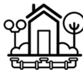
Vivienda y Urbanismo